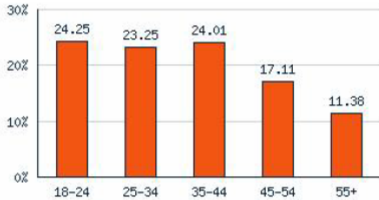
Encarta 用户的年龄构成（2006 年 8 月 26 日前四周）